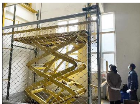
图三 液压升降平台安全检查